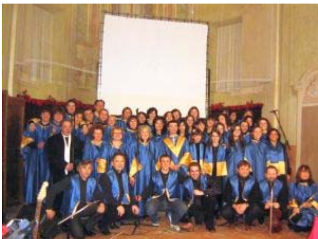
Una foto recente del coro «Voci di Giubilo», dopo un concerto nella chiesa di San Rocco a Guastalla: quasi tutti i coristi e i musicisti hanno partecipato, a vario titolo, a Fino al terzo Cielo