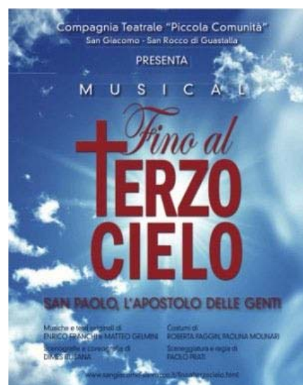
La locandina del musical «Fino al terzo Cielo»

A portare in scena il musical è la compagnia teatrale Piccola Comunità , nata quasi naturalmente all'interno dell'unità pastorale di San Giacomo e San Rocco di Guastalla. Il luogo, in realtà, non è affatto casuale: da molti anni la parrocchia di San Giacomo è impegnata con successo in una "pastorale dell'arte" realizzata attraverso la musica e l'attenzione alla drammaturgia. Negli ultimi dieci anni, il gruppo ha dato vita a serate di varietà e rappresentazioni "minori" (in cui i giovani hanno scoperto il piacere del palcoscenico e, nell'offrire intrattenimento, hanno cementato i loro legami), come pure a spettacoli più impegnativi.