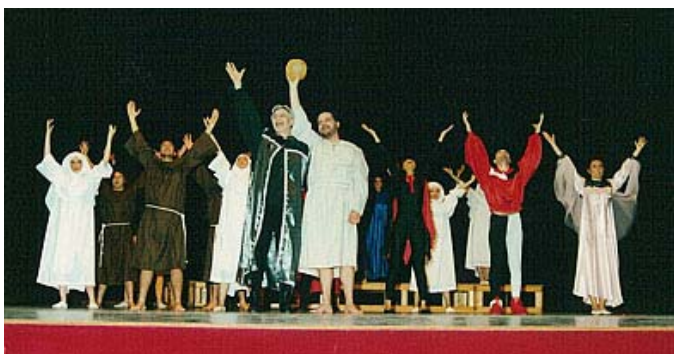
La scena finale di Semplicità sorella mia , il primo grande impegno teatrale che ha coinvolto la comunità di San Giacomo a partire dal 1996; i protagonisti di quello spettacolo hanno parti di rilievo anche nel nuovo musical su Paolo di Tarso