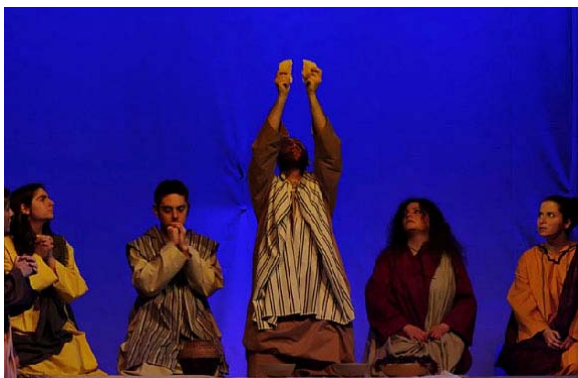
Momenti di condivisione: sopra, la prima comunità spezza il pane; a destra, la compagnia prega insieme sul palco